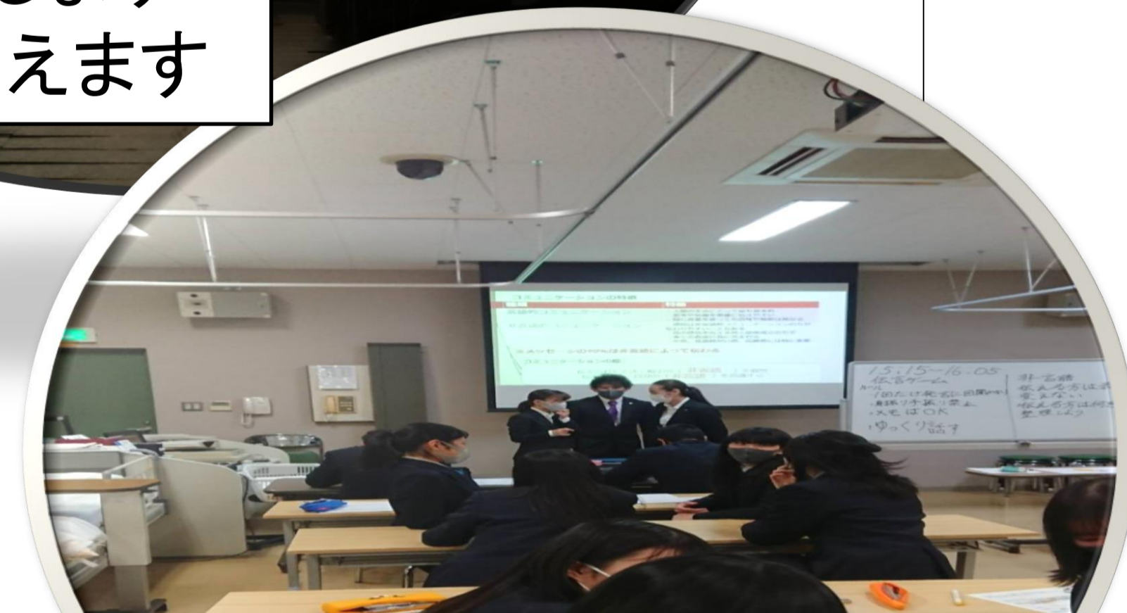
大学で模擬授業をして、高校の授業に臨みます