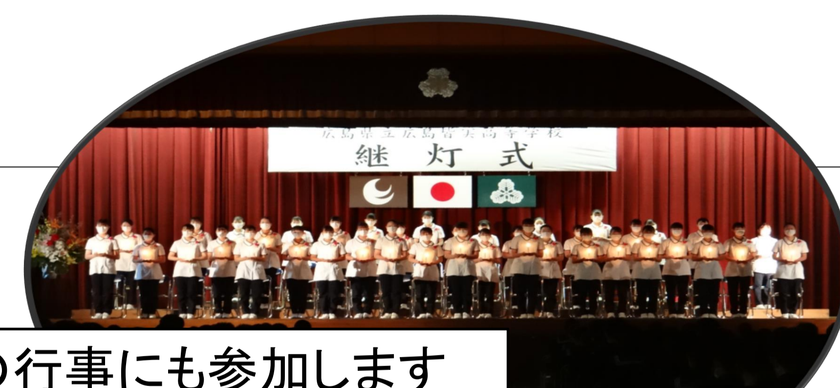
看護科の行事にも参加します ナイチンゲール誓詞を唱えます

始業前： 職員朝礼、実習見送り等 SHR： 連絡事項の伝達 朝学・提出物の提出 1～7限： 看護科目の授業や他科目の授業見学 掃除： 生徒と一緒に掃除 SHR： 次の日の予定等の伝達 放課後： 部活動の見学、実技練習指導